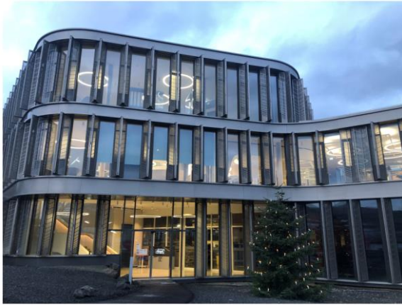
Abbildung 3: Nachhaltigkeit auch in Unternehmenszentrale WI.com: Die Fassade des Gebäudes passt sich an die klimatischen Gegebenheiten an und dient als Wärmedämmung.