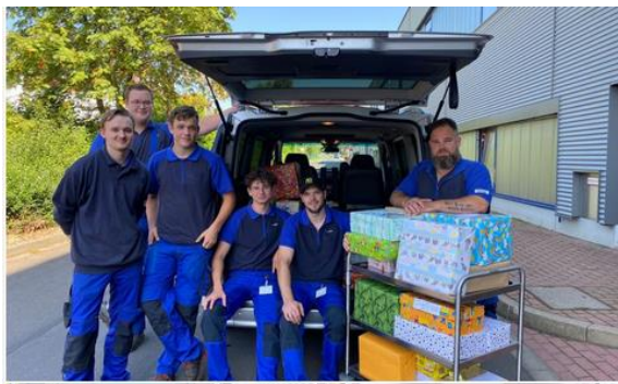
Abbildung 4: WIforyou Aktion - "Ein Schuhkarton für glückliche Kinderherzen": Die Kartons wurden von WIKUS-Mitarbeitern zusammengestellt, an die Betroffenen der Hochwasserkatastrophe gespendet und enthalten sowohl Bastelmaterial als auch Spielzeug.