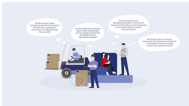
Figura 2: il sistema di gestione degli ordini e del magazzino WistockIT® agisce sull'intero processo Purchase-to-Order del cliente e consente di risparmiare tempo e costi.