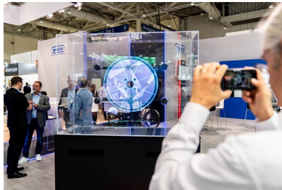
Figura 2: la hoja de sierra circular de precisión KREOS® se presentó digitalmente en acción en la EMO 2023 y atrajo la atención de los visitantes como holograma.

Actuación empresarial sostenible y adaptada al futuro: estos fueron también los temas principales de la EMO 2023 de Hannover. En la principal feria del sector metalúrgico, WIKUS presentó soluciones de aserrado innovadoras, productos sostenibles destacados para la compra y el aprovisionamiento, así como medidas respetuosas con el medio ambiente que se están implantando en la sede central de la empresa en Spangenberg.